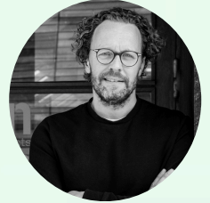
CHRISTIAN VEDDELER 3XN ARCHITECTS