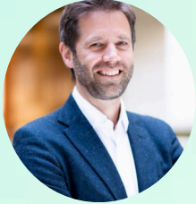
PETER EPPING URBAN PARTNERS