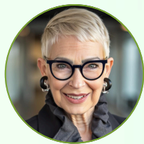
CAROL COLETTA BLOOMBERG CENTER FOR PUBLIC INNOVATION