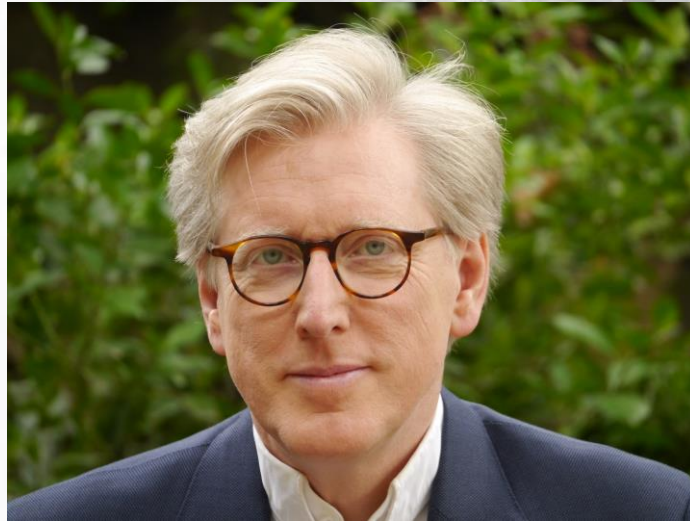
Theo Koll | ZDF Hauptstadtstudio

Eine gesellschaftspolitische Momentaufnahme“