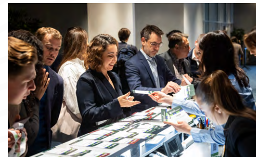
Table à 5 000 €