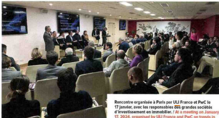
Rencontre organisée à Paris par ULI France et PwC le 17 janvier, avec les responsables des grandes sociétés d'investissement en immobilier. / At a meeting on January 17, 2024, organised by ULI France and PwC on trends in the property market, with the main Paris-based investors.