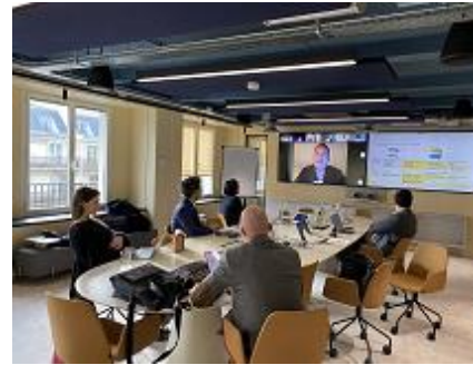
Lancement du groupe de travail le 21/02/23, PIMCO PRE