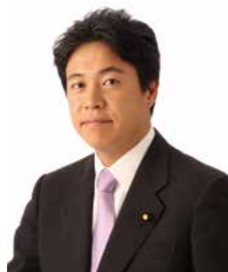
鶴保 庸介氏 参議院議員 前国土交通副大臣 Yosuke Tsuruho House of Councillors Former Senior Vice Minister of Land, Infrastructure, Transport and Tourism