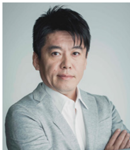
堀江 貴文 氏 SNS media&consulting 株式会社 ファウンダー

Takafumi Horie Founder SNS media&consulting